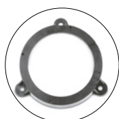
Entretoise woofer compatibilité d'origine garantie