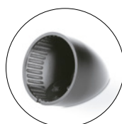
Support tweeter incliné Facilité d'installation Finition soft touch