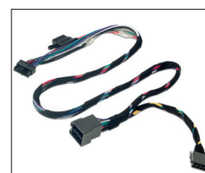
Faisceau de puissance