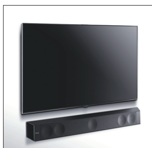
Dimension fixée au mur