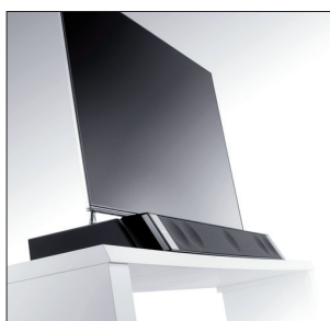
Dimension posée sur un meuble, associée à Dimension Sub