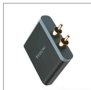
Compatible avec le Récepteur aptX® pour transmission audio sans fil de sources Bluetooth®