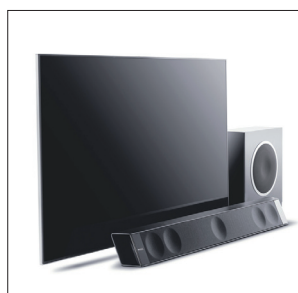
Compatible également avec le subwoofer sans fil Sub Air